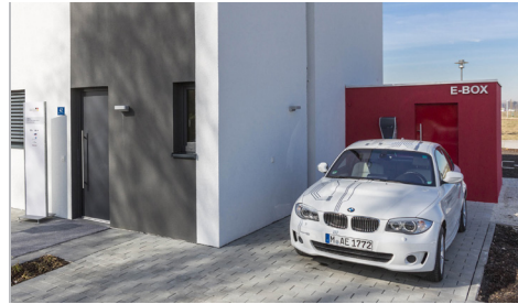
Das UMG verbindet die bordeigenen Systeme mit dedizierten Sensoren und stellt die Daten in einem QLM Dataset zur Verfügung. The UMG integrates on-board systems with dedicated sensors and combines the collec-