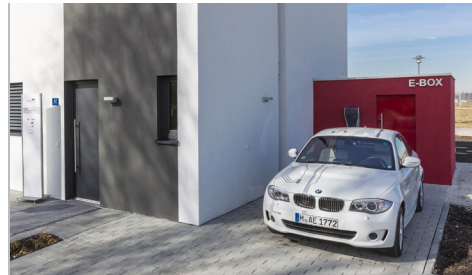
Das UMG verbindet die bordeigenen Systeme mit dedizierten Sensoren und stellt die Daten in einem QLM Dataset zur Verfügung. The UMG integrates on-board systems with dedicated sensors and combines the collec-